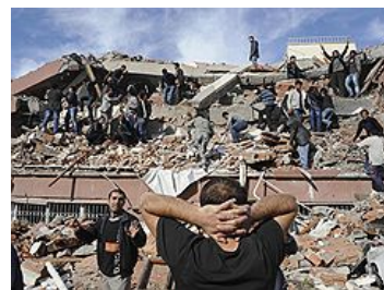
Землетрясение в Турции